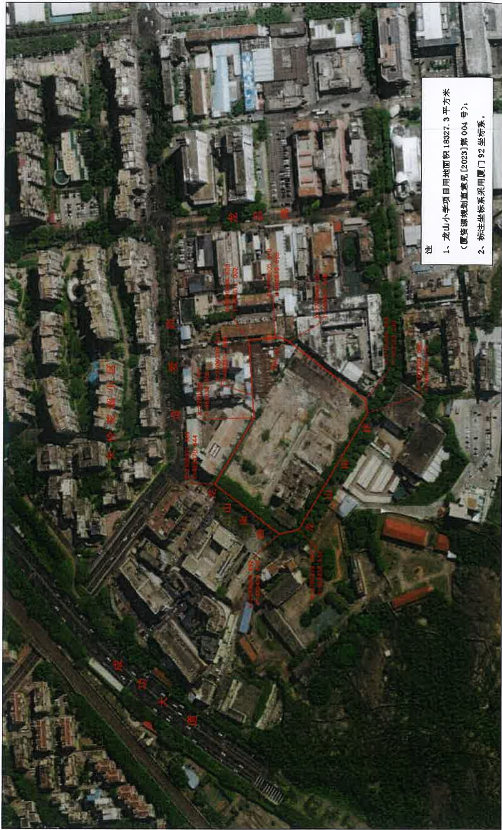
龙山小学项目用地范围示意图