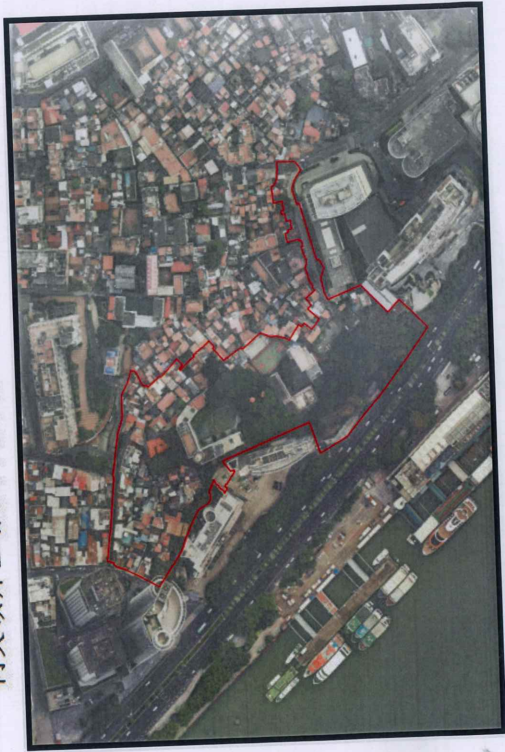
同文顶片区有机更新项目（首开区）范围示意图